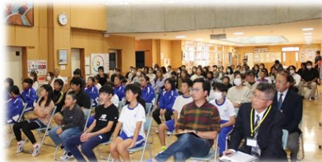
情報モラル講演会