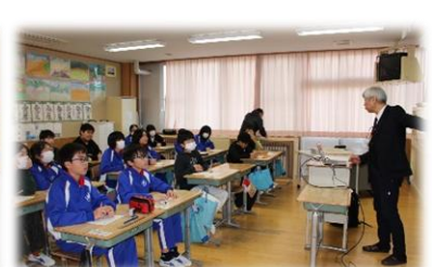
薬物乱用防止教室