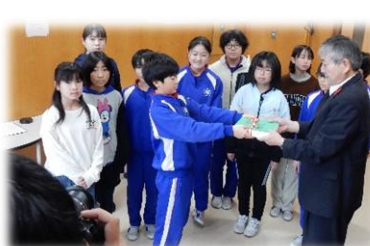
赤い羽根共同募金贈呈式