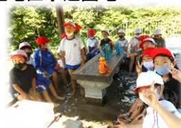
3年 旧南畑小学校・鶯宿温泉

どの学年も、それぞれの地区で奉仕活動で汗を流し、そのあと、川で遊んだり、昔語りを聞いたり、足湯に浸かったりと楽しみがありました。