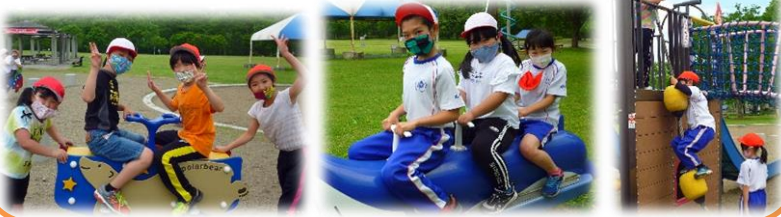
2年生 ファミリーランドの様子

地域の豊かな資源（ひと・もの・こと）のもつ「価値（すばらしさ）」を学び、地域の豊かな資源（ひと・もの・こと）に対する「関わり」「思い」をもつ子どもを育てたいと考えています。