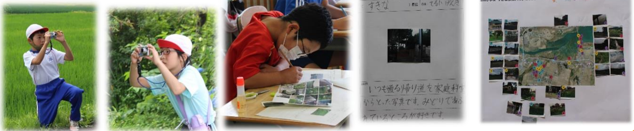
4年生 景観学習の様子

自分たちが育っている御所という地区にはどんな人達がいて、どんなもの（産業や建物、自然など）があって、どんなこと（伝統芸能など）が伝わっているのか、ふるさとの素晴らしさを知り、将来にわたって積極的にかかわっていく子ども達になってほしいと願っています。