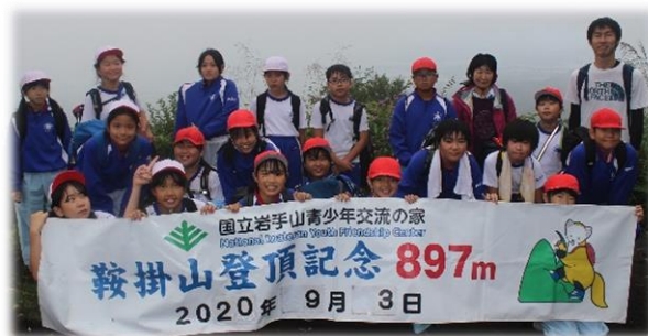
5年 林間学校 鞍掛山山頂より