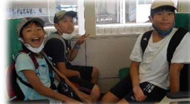
たんぼぼ・ひまわり (盛岡駅)