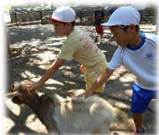
2年 盛岡市動物公園